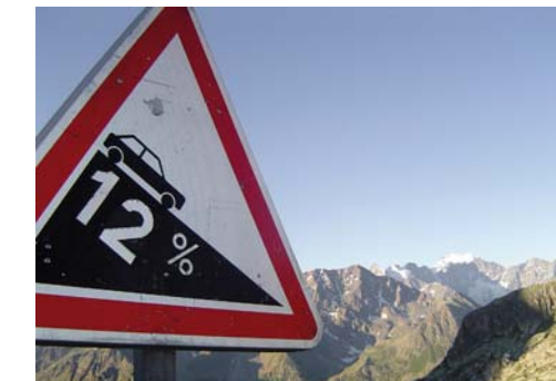
Des descentes à vous couper le souffle !