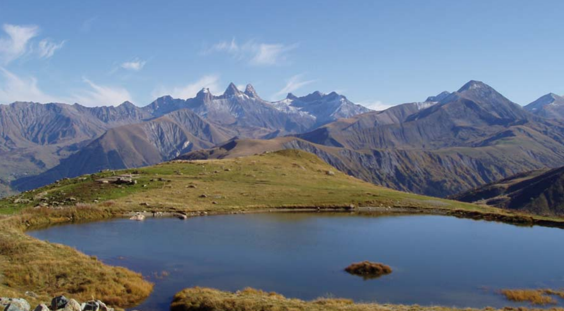
Le Lac suspendu

Pour cette 48 e édition, Vizille sera à nouveau la ville d'accueil du BRA et vous offrira la fraîcheur de son parc du château et ses 100 hectares de jardins et étangs.